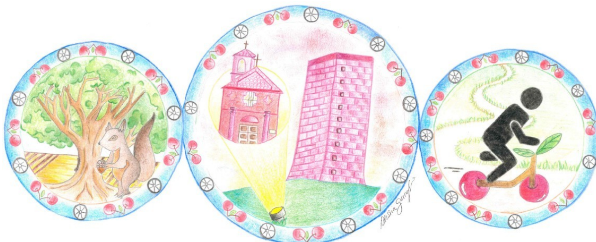
ARTISTA: ALESSIA GAROFANO