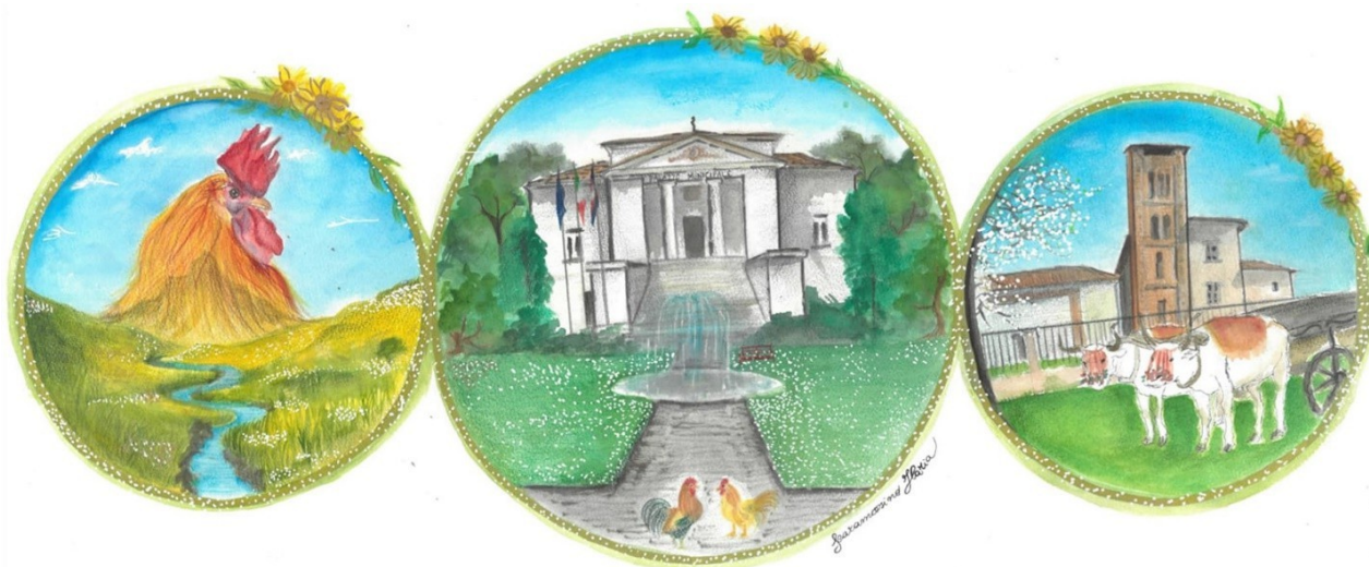
ARTISTA: Ilaria Scaramozzino