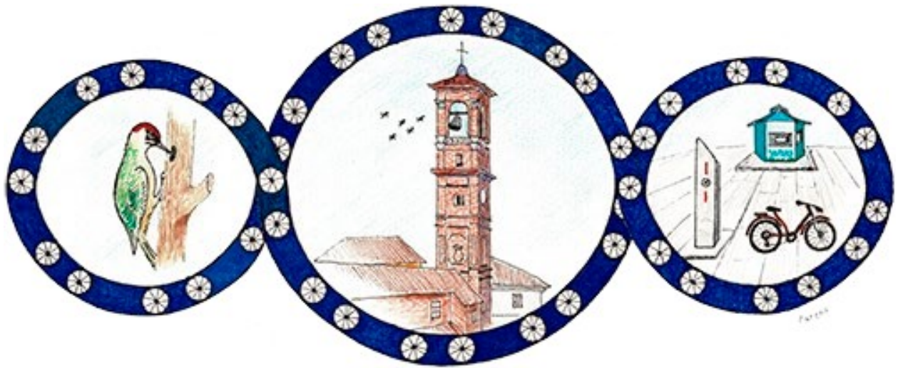
ARTISTA: Giorgio Parena