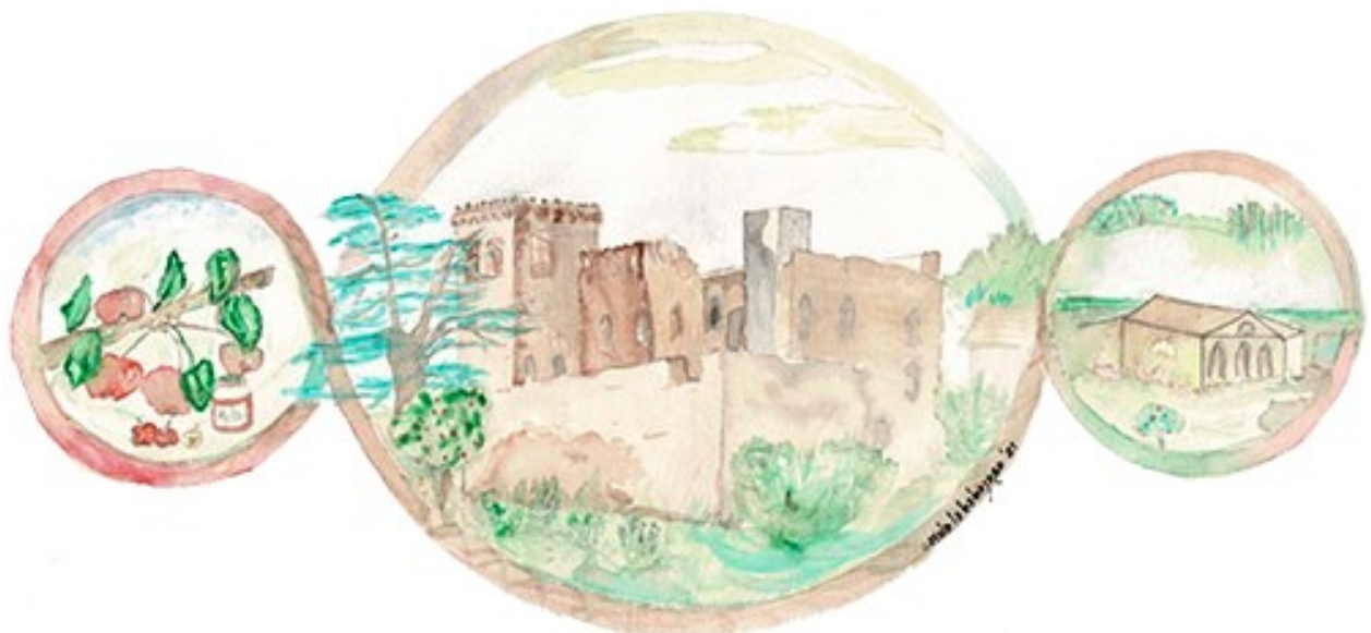
ARTISTA: Carola Chinaglia