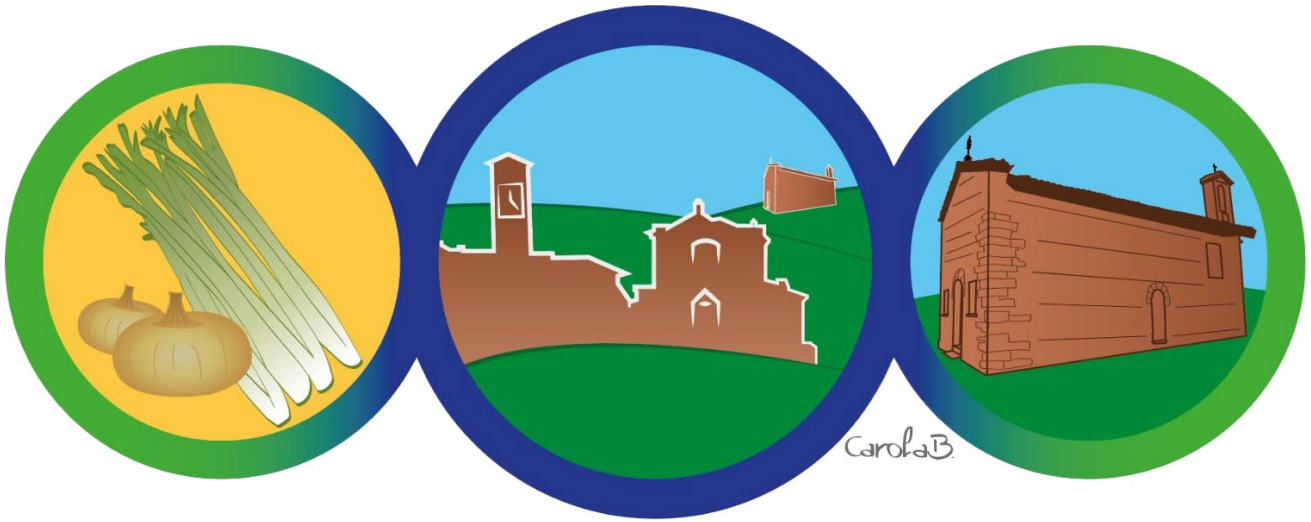
ARTISTA: CAROLA BAIOTTI