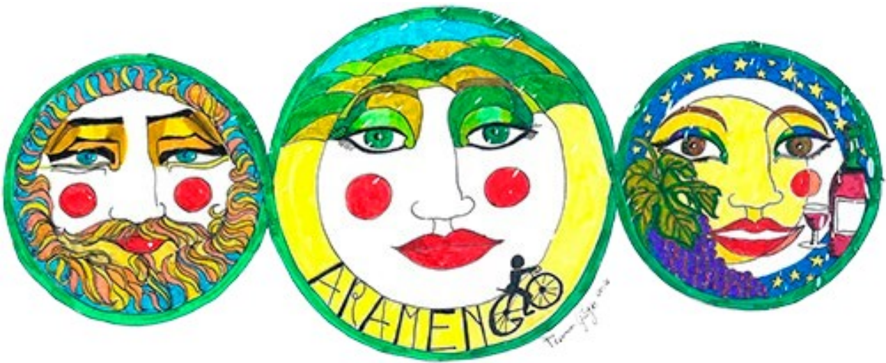
ARTISTA: GIORGIO FRANCO