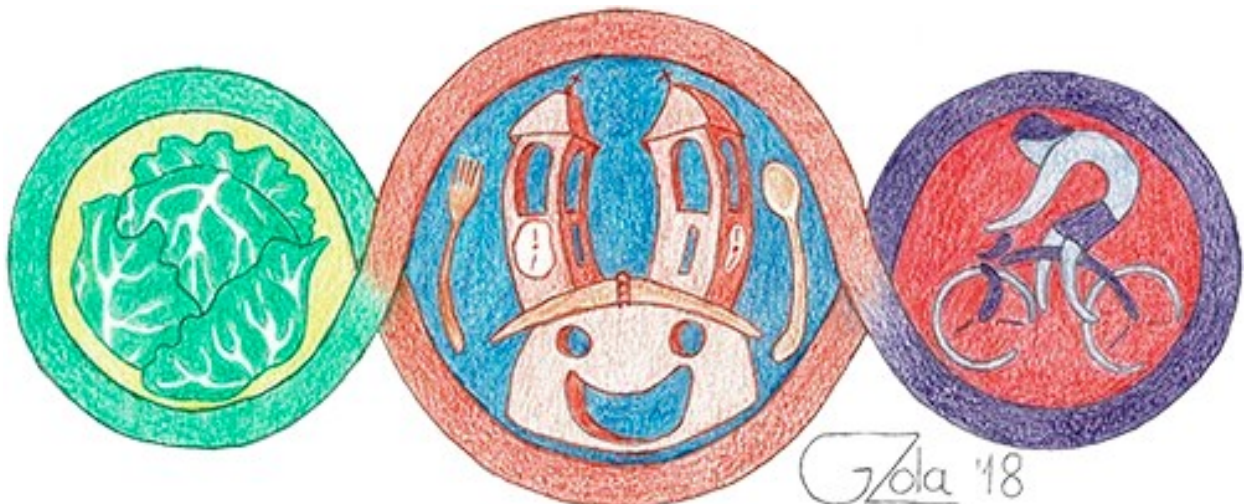
ARTISTA: Giorgio Zola