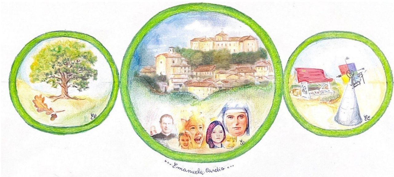
ARTISTA: Emanuela Cardis